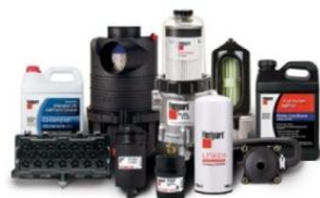
Масла и фильтры