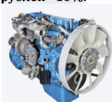
Двигатель и его комплектующие

При покупке до 30 000 рублей - 3%, от 30 000 до 50 000 рублей - 5%, от 50 000 до 100 000 рублей - 7%, свыше 100 000 рублей - 10%.