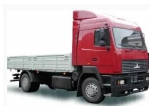
Элементы кабины, кузова